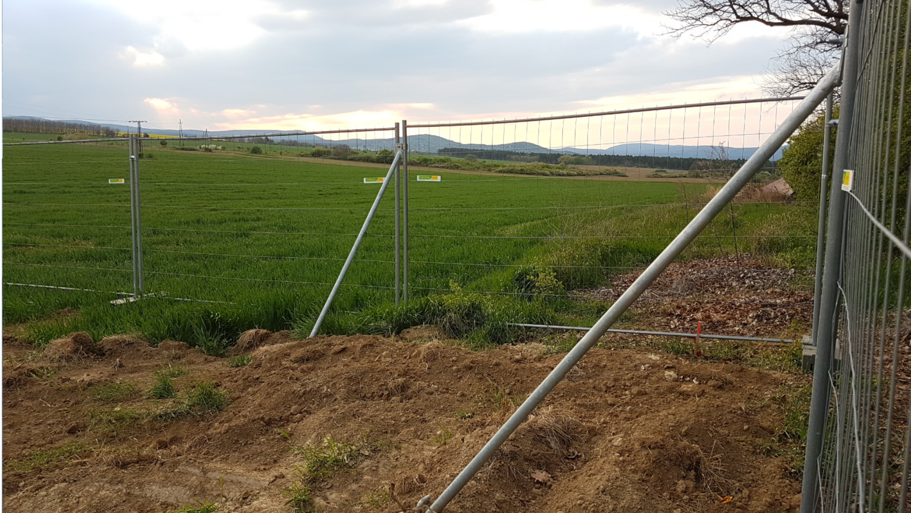
Táblás mobil kerítés

Munkaterületek, építési területek bekerítésére; ideiglenes tároló területek, raktár területek lekerítésére, rendezvényterületek lezárására javasolt.